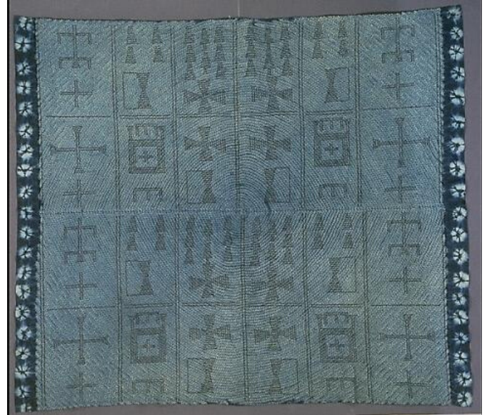
Adire resist cloth wall hanging. Nigeria, Africa. 20th Century AD. Gift of Lloyd E. Cotsen and the Neutrogena Corporation, Museum of International Folk Art.

Cuando la cera o un almidón que bloquea la penetración del tinte se aplica mediante un pincel o un bloque, se denomina impresión resistente. Cuando la tela se pone en la solución de tinte, las áreas de resistencia siguen siendo el color original. Batik de Indonesia, patrones de adire y plantillas de Nigeria y patrones dibujados y las plantillas de Japón utilizan esta técnica. El tjanting y el tjegul son herramientas de batik que se originaron en Indonesia. Se han utilizado pinceles, plumas, peines y otros instrumentos para crear patrones de resistencia.