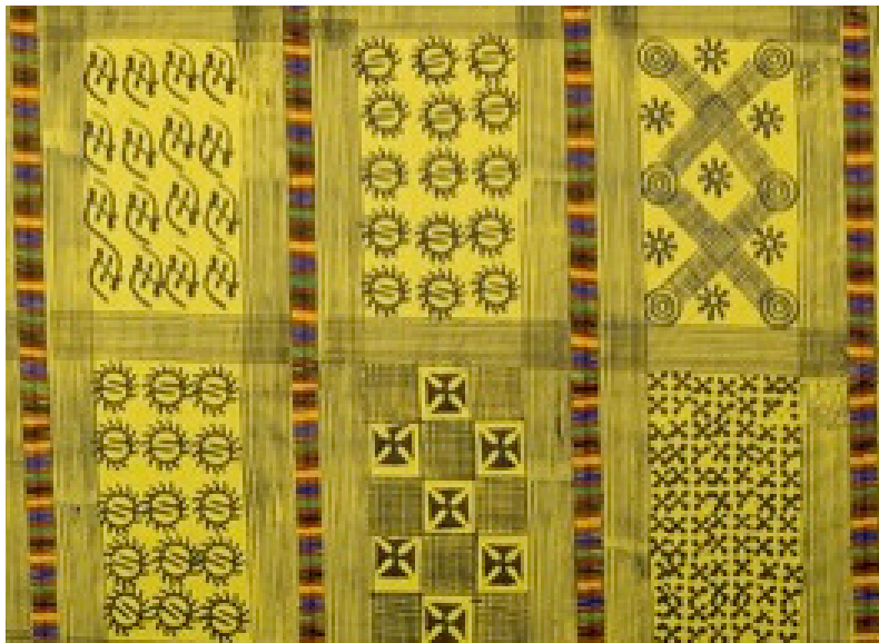
Adinkra Cloth. Ashanti, Ghana, Africa. ca. 1960. Gift of the Girard Collection. Museum of International Folk Art.

En la India e Irán, se utiliza otro método mediante el cual los mordientes —los agentes químicos que crean el vínculo entre la fibra y el tinte— se aplican a la tela sin teñir ya sea imprimiendo o pintando con un pincel o una pluma. Cuando la tela se sumerge en el baño de tinte las áreas con mordiente toma el color mientras que el resto de la tela permanece sin teñir. En la India, el tejido resultante se llama kalamkari , lo que significa trabajo de pluma. En Irán se conoce como qalamkar .